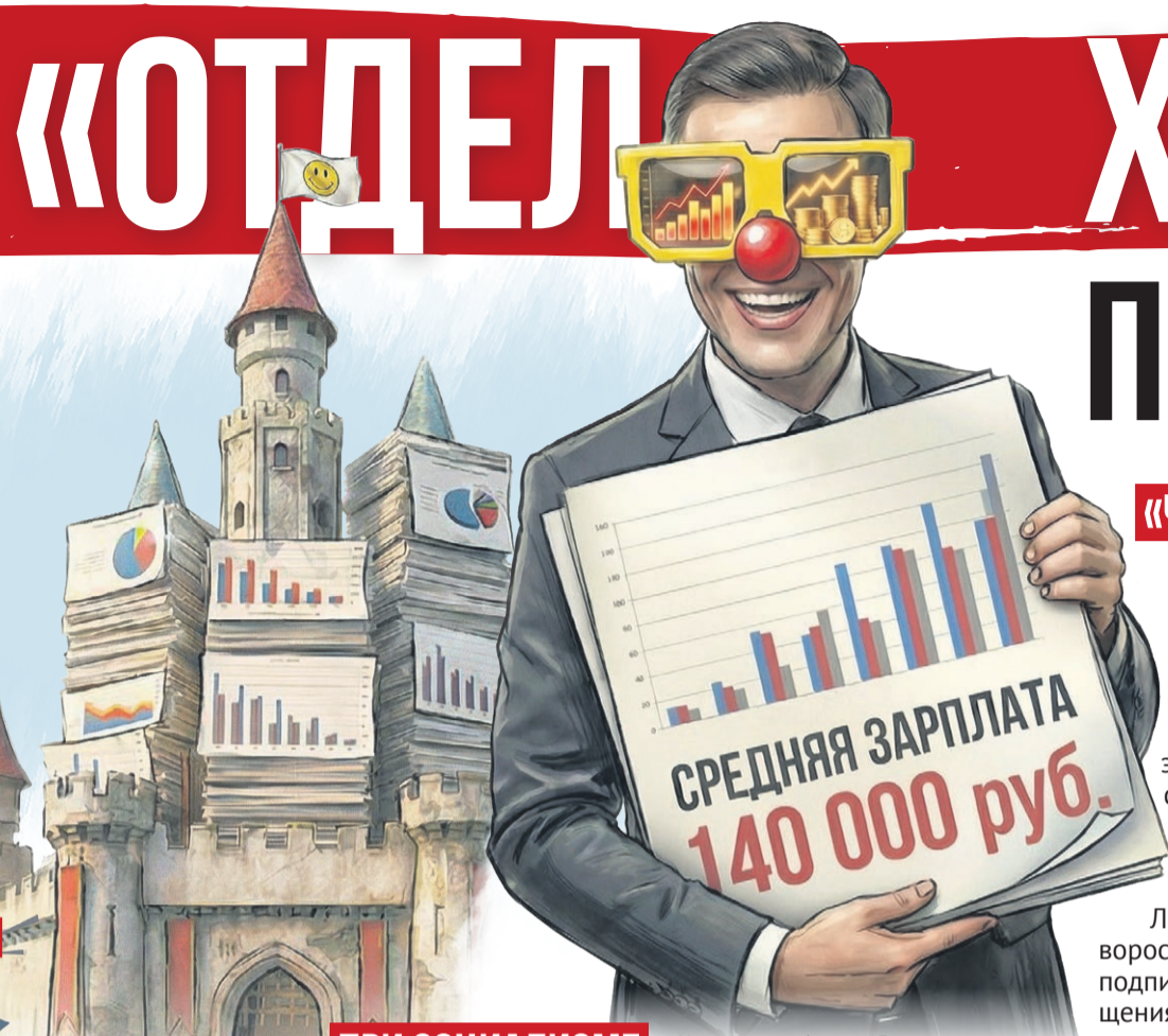
Иллюстрация: Алексей Беленев