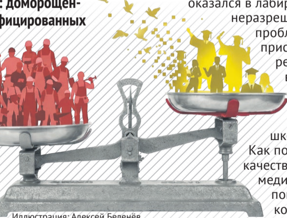
Иллюстрация: Алексей Беленёв