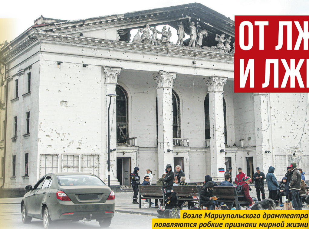
Возле Мариупольского драмтеатра появляются робкие признаки мирной жизни