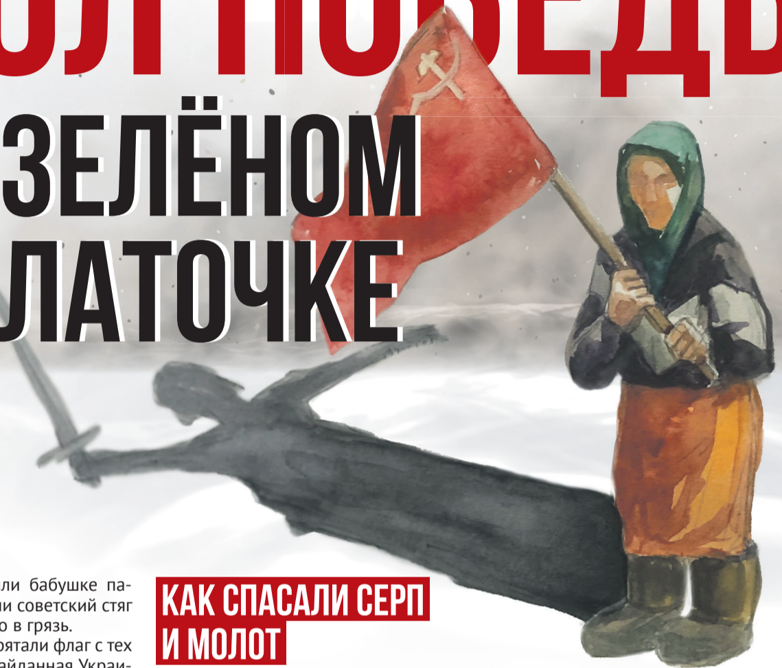
Рисунок Елены Рябоваловой, коллаж Алексей Беленёв