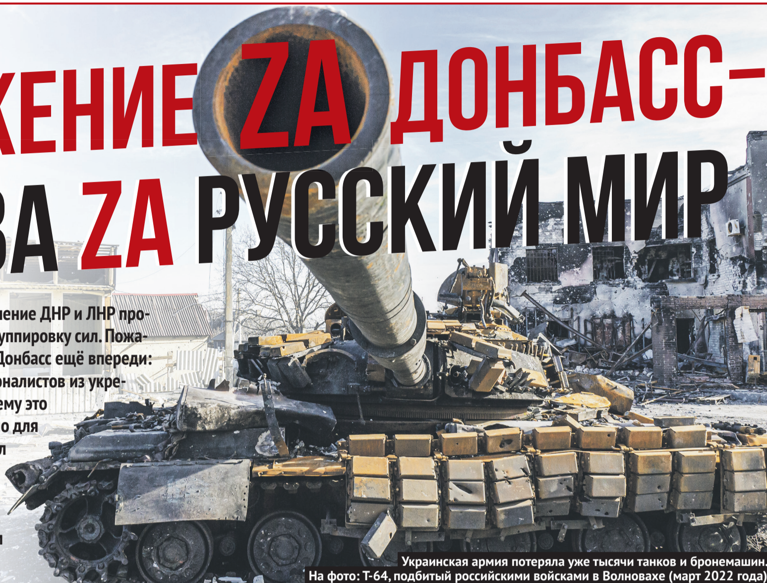
Украинская армия потеряла уже тысячи танков и бронемашин. На фото: Т-64, подбитый российскими войсками в Волновухе (март 2022 года)