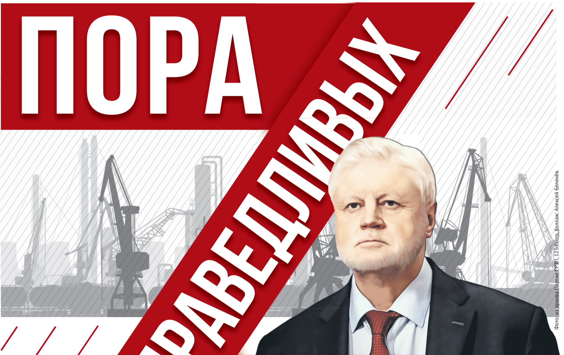
Фото: из архива Партии СРЭП, 1251f.com. Коллаж: Алексей Беленёв.

Как именно Приморский край может преодолеть последствия санкций? И почему кризис – это окно возможностей для каждого из нас?