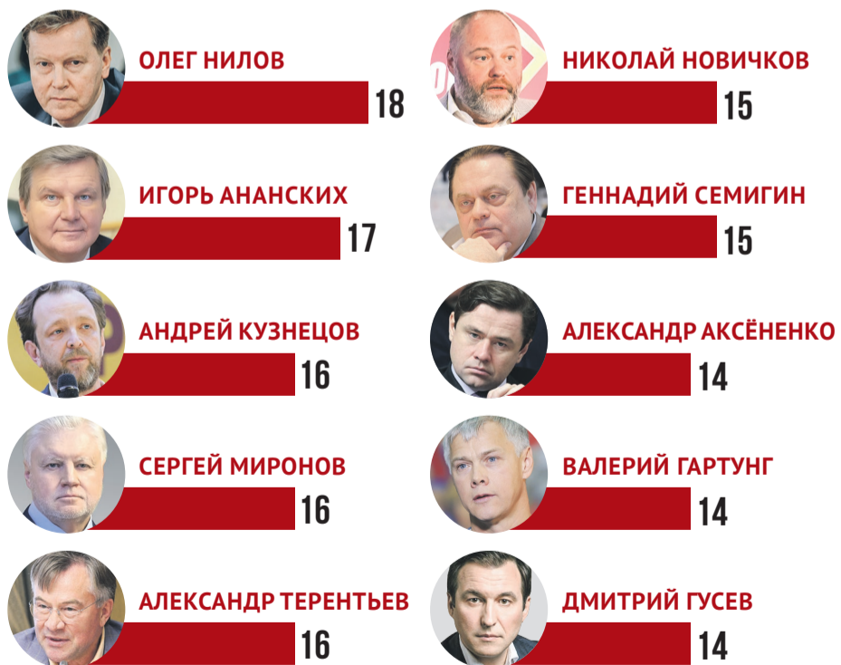
Число внесенных законопроектов